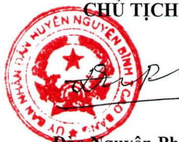
Đào Nguyên Phong